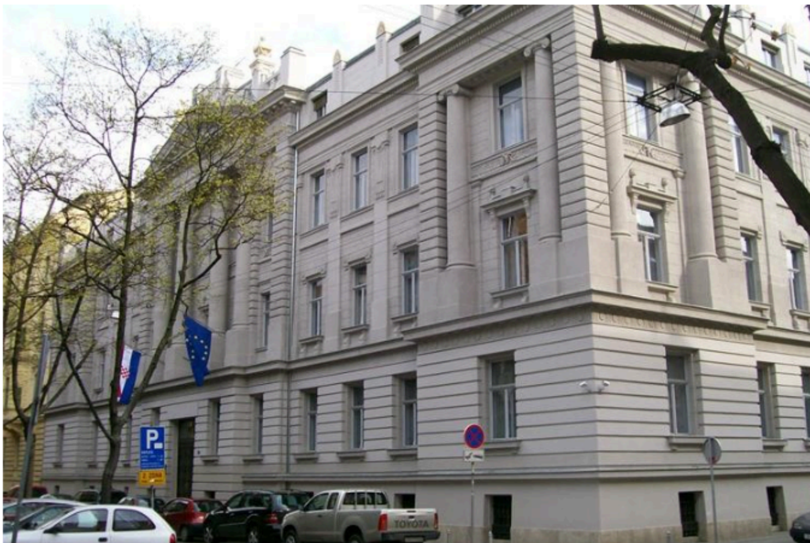
Državna riznica sustav je upravljanja javnim novcem.