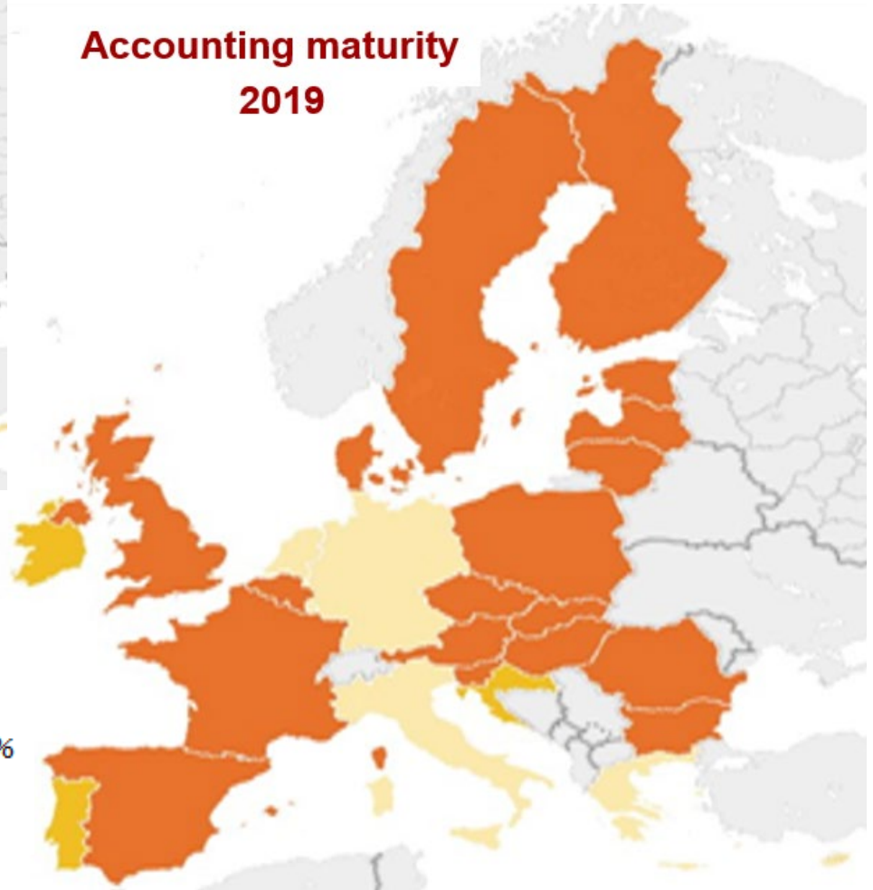
Accounting maturity 2019